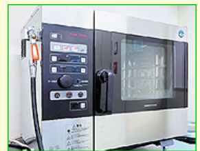
肉も野菜もふっくら仕上がるスチームコンベクションオーブン。