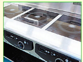
清掃が簡単なIH調理器。

中でも、食育を重視し子どもたちの笑顔と健康的な成長をサポートするうえで、電化厨房は大きく貢献してくれています。特に、スチームコンベクションオーブンを導入したことで、ふっくら仕上がるパンやケーキが子どもたちの人気の的になったのをはじめ、おやつ以外のメニューも肉や魚に美味しいような焦げ目が付くなど、とてもおいしく仕上がるようになりました。また、IHコンロはさっと拭くだけで綺麗になるので、掃除が楽になり大変助かっています。監査の方がいらっしゃった際にも、室温も雑菌が繁殖しない温度に保たれていて、理想的な衛生状態だと褒めていただきました。栄養士二人体制で運営できる分、食材にしっかりとお金をかけるだけでなく、電化厨房の安全性や効率性をうまく活用して、給食交流会の開催や手作りレシピ本の配布など保護者への手助けも充実するなど食育活動に力を注いでいます。