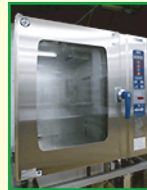
■ スチームコンベクションオープン

移転新築を計画していた時期に、東京電力のお得な料金メニューと最新の電化システムについて紹介している雑誌の記事を見て、これだと思わずに東京電力に問い合わせたのが始まりでした。それから、幾度となく視察や試算を重ねて、入居する高齢者と働くスタッフが共に快適で満足できる施設とするため、厨房・空調・床暖房への電化の採用を決めました。衛生的で火災の心配も少ない快適な電化厨房で、入居者の一番の楽しみである食事をスタッフが心を込めて調理。地元で収穫された野菜なども積極的に取り入れています。出来上がった料理は、配膳車で各ユニットへ運び、盛り付けから食事のサポートまで、入居者一人ひとりに合わせたきめ細やかな食事サービスを提供しています。また、天井を高くとった広い空間全体を快適かつ効率的に暖めるため、厨房を含めた全館全室に蓄熱式電気床暖房を採用。入居者だけでなくスタッフにも働きやすい環境を整備することで、離職率の低下をもたらし、サービスの質向上にもつながると考えています。